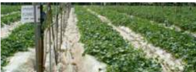
Γραμμική καλλιέργεια πεπονιού με χρήση OROSOIL®

Σημαντικό χαρακτηριστικό του OROSOIL® είναι η πλήρης απουσία της χρήσης οργανικών μητρών από βιομηχανικά, αστικά απόβλητα (MSW).