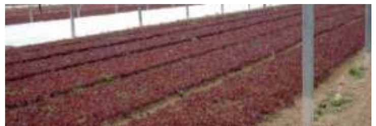
Καλλιέργεια λαχανικών κοπής 4ης γκάμας σε θερμοκήπιο με χρήση OROSOIL®

Το OROSOIL® συνιστάται για εδάφη των οποίων η μικροβιακή δραστηριότητα πρέπει να εμπλουτιστεί και να αναζωογονηθεί. Είναι ιδανικό για: